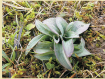
Winterblätter im Januar

Das Dreizählige Knabenkraut entwickelt im Spätherbst aus zwei kugelig bis eiförmigen, unterirdischen Knollen eine Winterblattrosette mit 5-8 bläulichgrünen, ungefleckten Grundblättern. Mit diesen assimilieren die Pflanzen im Winter. Dieses besondere Verhalten, welches auch für die heimischen Ragwurz-Arten gilt, weist darauf hin, dass die Art ursprünglich in Gegenden mit milden Wintern vorkam. Geringe Schneeaufgaben und vor allem Kahlfröste schwächen die Pflanzen, was wiederum Auswirkungen auf die Blühfähigkeit haben kann.