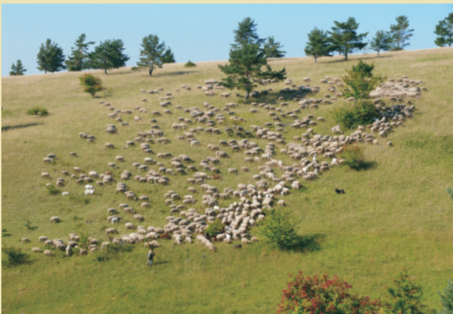
Durch Herbstbeweidung kann die Art gefördert werden.

Langjährige Erfahrungen aus Thüringen und Hessen belegen, dass sich mit einer auf die Blühphase und Samenbildung abgestimmten Schafbeweidung in Form konkreter Beweidungspläne, aber auch durch Mahd noch vorhandene Vorkommen gut regenerieren lassen. Dabei ist eine lockere Vegetationsstruktur mit einer kurzrasigen Grasnarbe anzustreben. Zu berücksichtigen ist auch die Winterblattbildung, d.h. keine Schafbeweidung ab November. Der Tritt der Schafe ist für die Ausbreitung wichtig, wobei die Beweidung relativ kurz aber intensiv oder mit einer lockeren Bestandsdichte erfolgen sollte. Eine Ausbreitung in der Fläche ist ebenfalls möglich, wenn sich im näheren Umfeld wiederbesiedelbare und gepflegte Biotope befinden - ein Beispiel, dass die Art auch durch Biotopverbund gefördert werden kann.