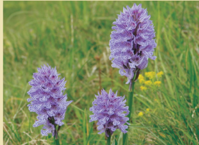
Hochblüte Anfang - Mitte Mai

Der 20-50 Blüten umfassende Blütenstand ist zunächst kegelförmig, dann halbkugelig und erreicht im Laufe der Aufblühphase eine walzenförmige Gestalt. Die Einzelblüten sitzen in der Achsel häufig zugespitzter Tragblätter, die etwa so lang wie die Fruchtknoten sind. Sie tragen einen geschlossenen Helm von oftmals auch verwachsenen Kelch- und Kronblättern. Diese sind außen hellrosa bis violettrosa gefärbt mit einer dunkel gefärbten Nervatur. Die Blütenlippe ist deutlich dreigeteilt.