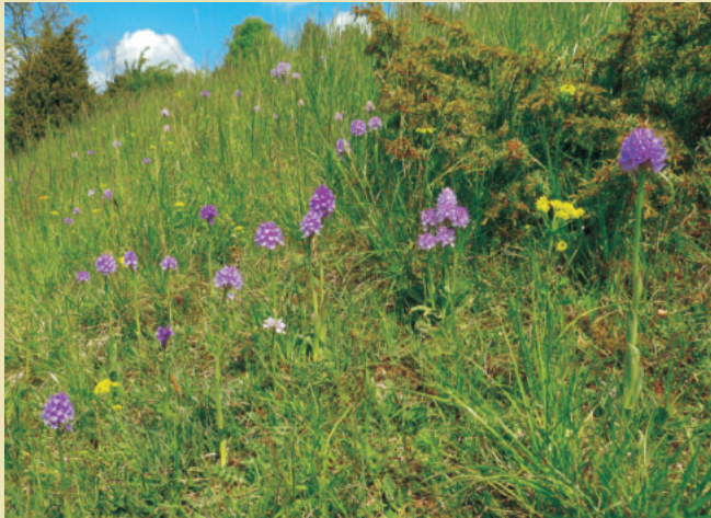
Typisches Biotop: Kalkmagerrasen mit Wacholdergebüsch über Zechstein

Mit der Orchidee des Jahres 2019, auch unter der ursprünglichen Artbezeichnung Orchis tridentata SCOP., 1772 bekannt, wollen die Arbeitskreise Heimische Orchideen Deutschlands auf eine Art aufmerksam machen, welche innerhalb der Bundesrepublik Deutschland nur inselartig verbreitet ist. Neben einem kleinen Teilgebiet an der Oder erstreckt sich das Hauptareal von Ostwestfalen über das südliche Niedersachsen, Nordhessen und das südliche Sachsen-Anhalt bis nach Ostthüringen. Im Süden bilden die Vorkommen entlang der Rhön und des Grabfeldes die Hauptverbreitungsgrenze. In Thüringen und Hessen kommt diese Orchideenart in teilweise aspektbildenden Beständen auf Halbtrockenrasen und ausgehagerten Mähwiesen über Zechstein und Muschelkalk vor. Die mediterran-submediterrane Art ist in Süddeutschland außer in einem kleinen Teilareal nicht anzutreffen. Sie kommt in einem geschlossenen Verbreitungsgebiet erst wieder in den Südalpen und im Mittelmeergebiet vor.